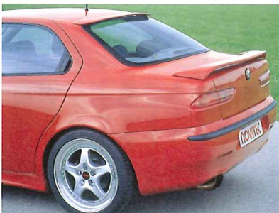
派手すぎないエアロ・パーツも魅力のノヴィテック。インテリアにもペダルやレバーなどに手が入っている。

取材協力 = ノヴィテックジャパン special thanks = NOVITEC Japan (TEL03-3551-7980) Designed by Katsumi Suzuki